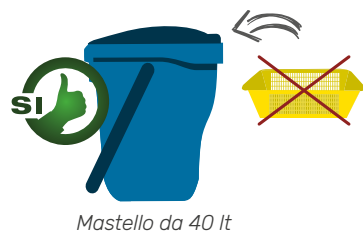
Mastello da 40 lt

Ad ogni utenza verrà consegnato un mastello Blu per la Carta e Cartone che sostituisce l'attuale cesta gialla ;