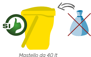
Mastello da 40 lt

Ad ogni utenza verrà consegnato un mastello Giallo per la Plastica che sostituisce le attuali buste ;